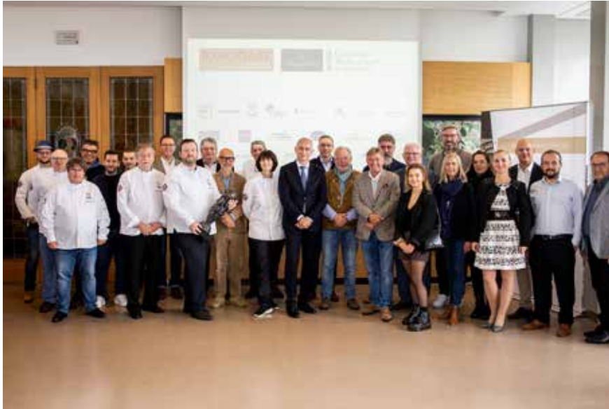
Les partenaires et organisateurs de l'EXPOGAST et du Villeroy & Boch Culinary World Cup 2022. Die Partner und Organisatoren der EXPOGAST und dem Villeroy & Boch Culinary World Cup 2022. The partners and organizers of EXPOGAST and the Villeroy & Boch Culinary World Cup 2022.