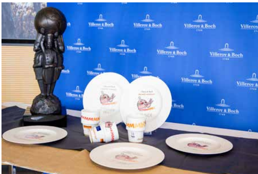
Les assiettes officielles de Villeroy & Boch, créées en collaboration avec l'artiste SUMO, ainsi que la coupe du Villeroy & Boch Culinary World Cup. Die offiziellen Teller von Villeroy & Boch, die in Zusammenarbeit mit dem Künstler SUMO entworfen wurden, sowie der Pokal des Villeroy & Boch Culinary World Cup. The official plates by Villeroy & Boch, created in collaboration with the artist SUMO, and the trophy of the Villeroy & Boch Culinary World Cup.